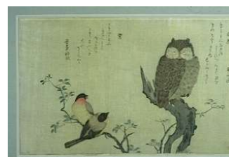
Kitagawa Utamaro, Hibou sur un tronc d'arbre et deux rouges-gorges