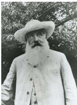
Claude Monet dans son jardin, photographié par Sacha Guitry vers 1913