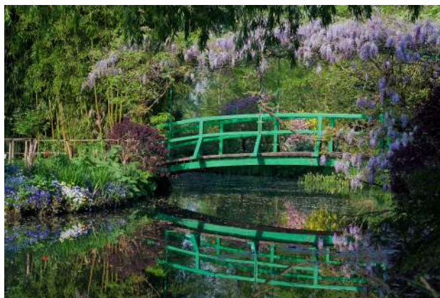
Vue du jardin d'eau Maison et Jardins Claude Monet. Giverny